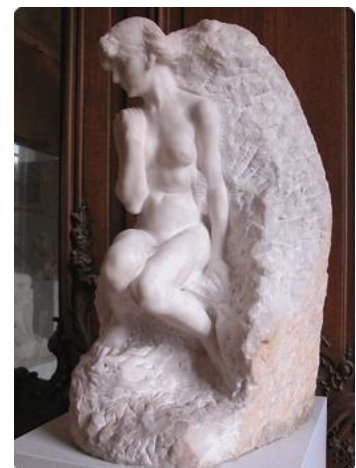
Galatée en marbre de Rodin (1840-1917) - 1889 http://gazette.ditaime.com/article/227.html