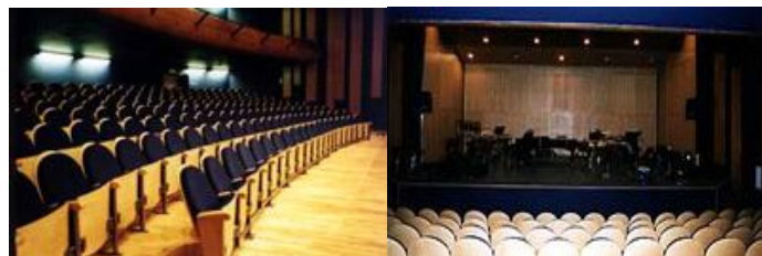
Le Théâtre Cité Bleue à Genève

L'œuvre sera donnée jeudi 25 et vendredi 26 octobre 2012 à 20h30 au Théâtre Cité Bleue (Genève - Champel)