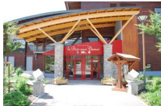
« Le Bois aux Dames » à Samoëns

L'œuvre sera donnée jeudi 25 et vendredi 26 octobre 2012 à 20h30 au Théâtre Cité Bleue (Genève - Champel)