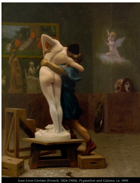
Jean-Léon Gérôme (French, 1824-1904), Pygmalion and Galatea , ca. 1890

On le voit, cette collaboration est intense, régulière, elle mérite une attention particulière, en plus de toute notre action menée dans la campagne genevoise et de notre résidence au Théâtre Cité Bleue de Champel