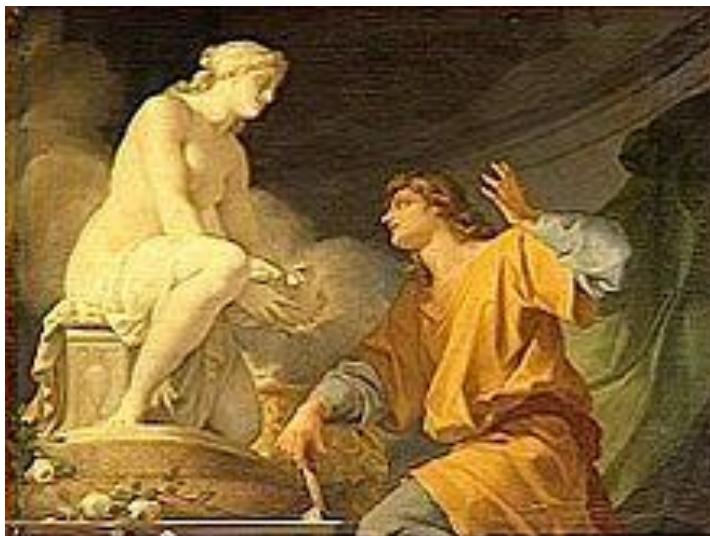
Jean-Baptiste Regnault (1754-1829) - 1786

L'expression "un pygmalion" désigne le manager d'un artiste. C'est une personne qui par sa notoriété ou ses moyens permet de faire connaître l'art de l'artiste. Cette expression fait directement référence à la mythologie grecque et à la légende de Pygmalion et Galatée. Profondément choqué par l'attitude des femmes de Chypre prostituées dites les Propétides, Pygmalion, sculpteur de son état, se voua au célibat. Ayant sculpté une magnifique statue de femme qui représentait pour lui la perfection féminine, il supplia la déesse Aphrodite de lui donner une femme semblable à son objet de désir.