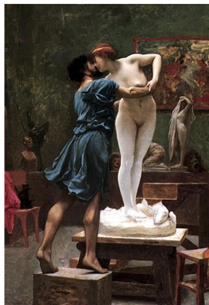
Jean Léon Gérôme (1824-1904) 1890