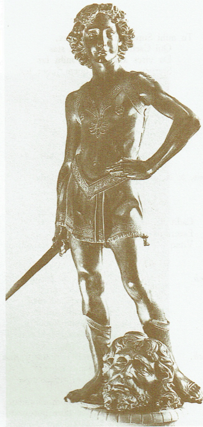
Verrocchio (1435-1477) Musée du Bargello-Firenze