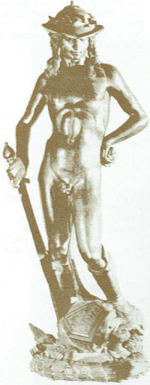
Donatello Musée du Bargello-Firenze