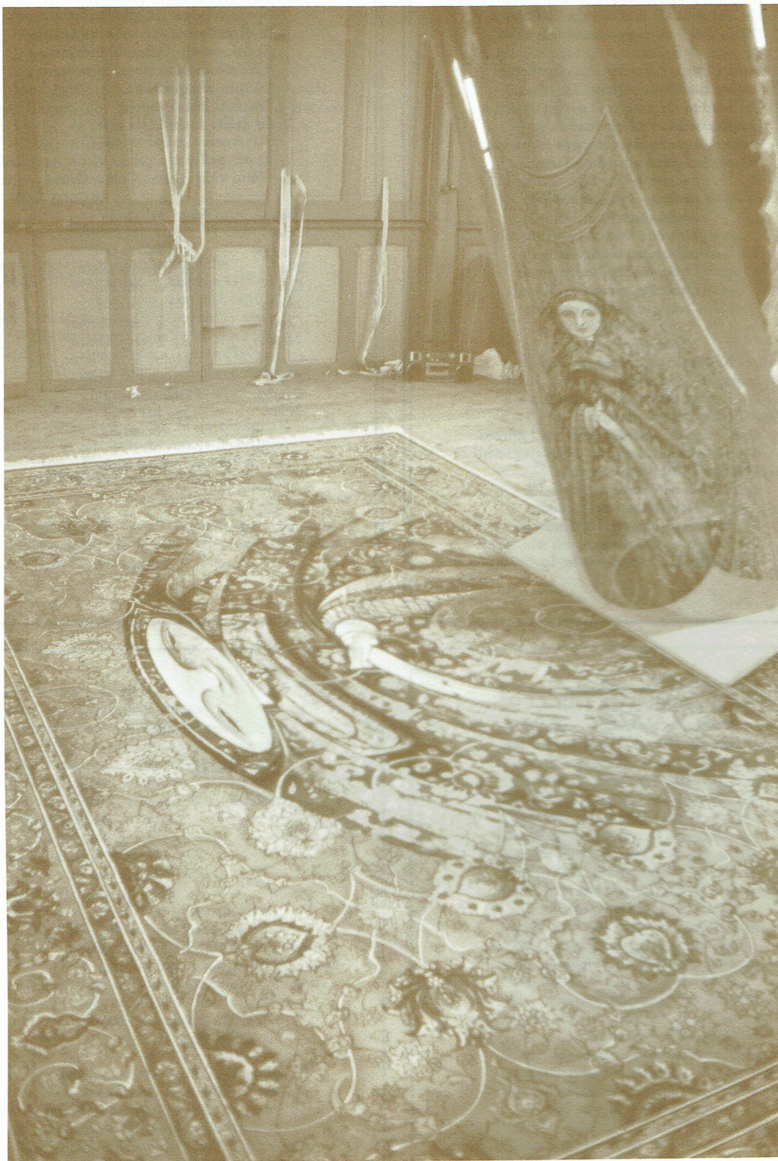
Confection du tapis et construction de l'anamorphose dans les ateliers de l'Opéra-Studio