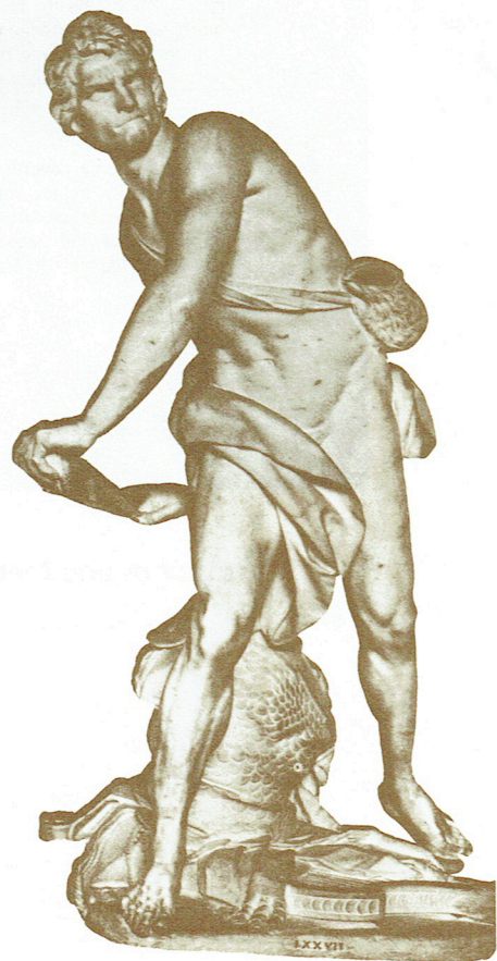
Le Bernin (1598-1680)