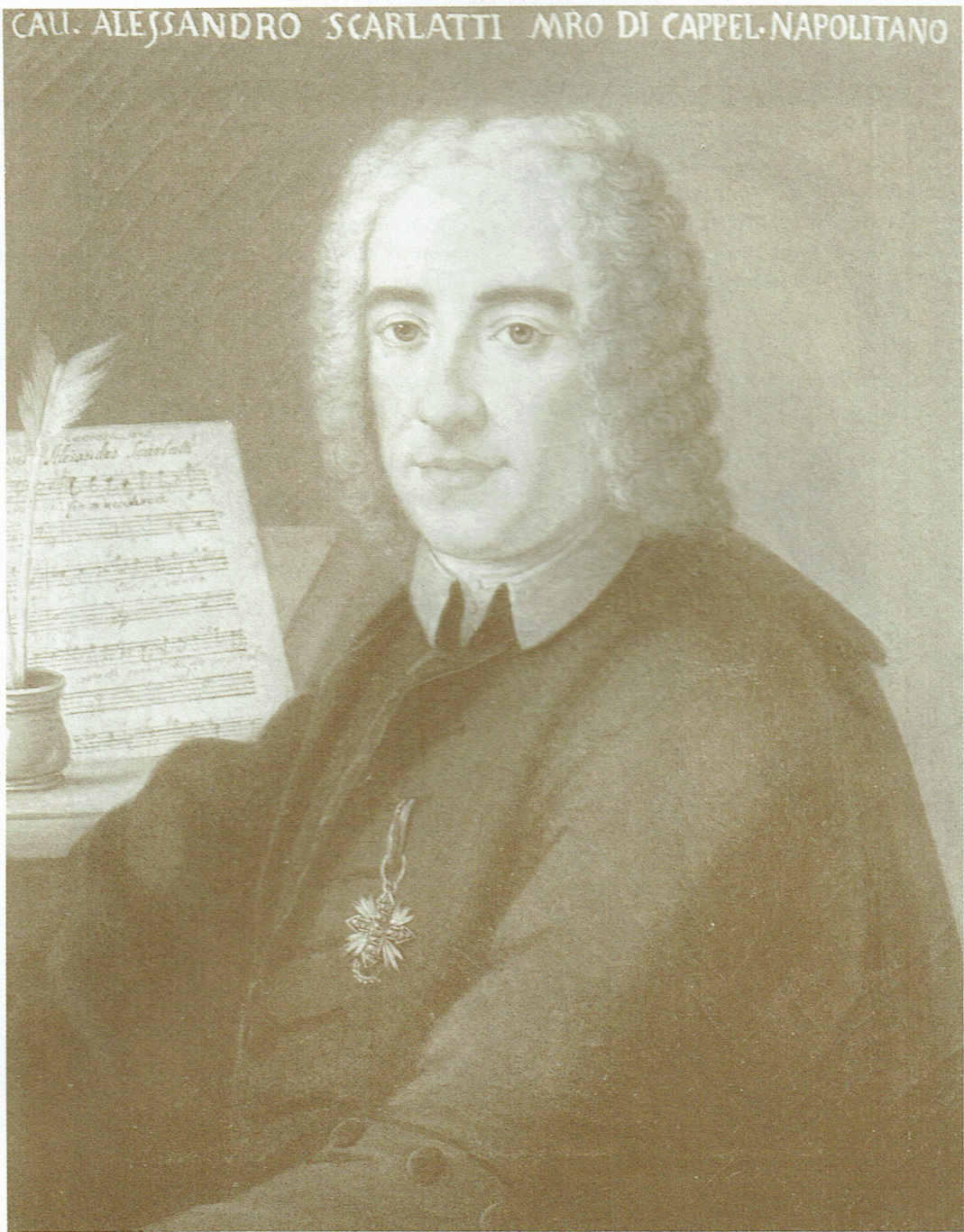
Portrait anonyme d'Alessandro Scarlatti