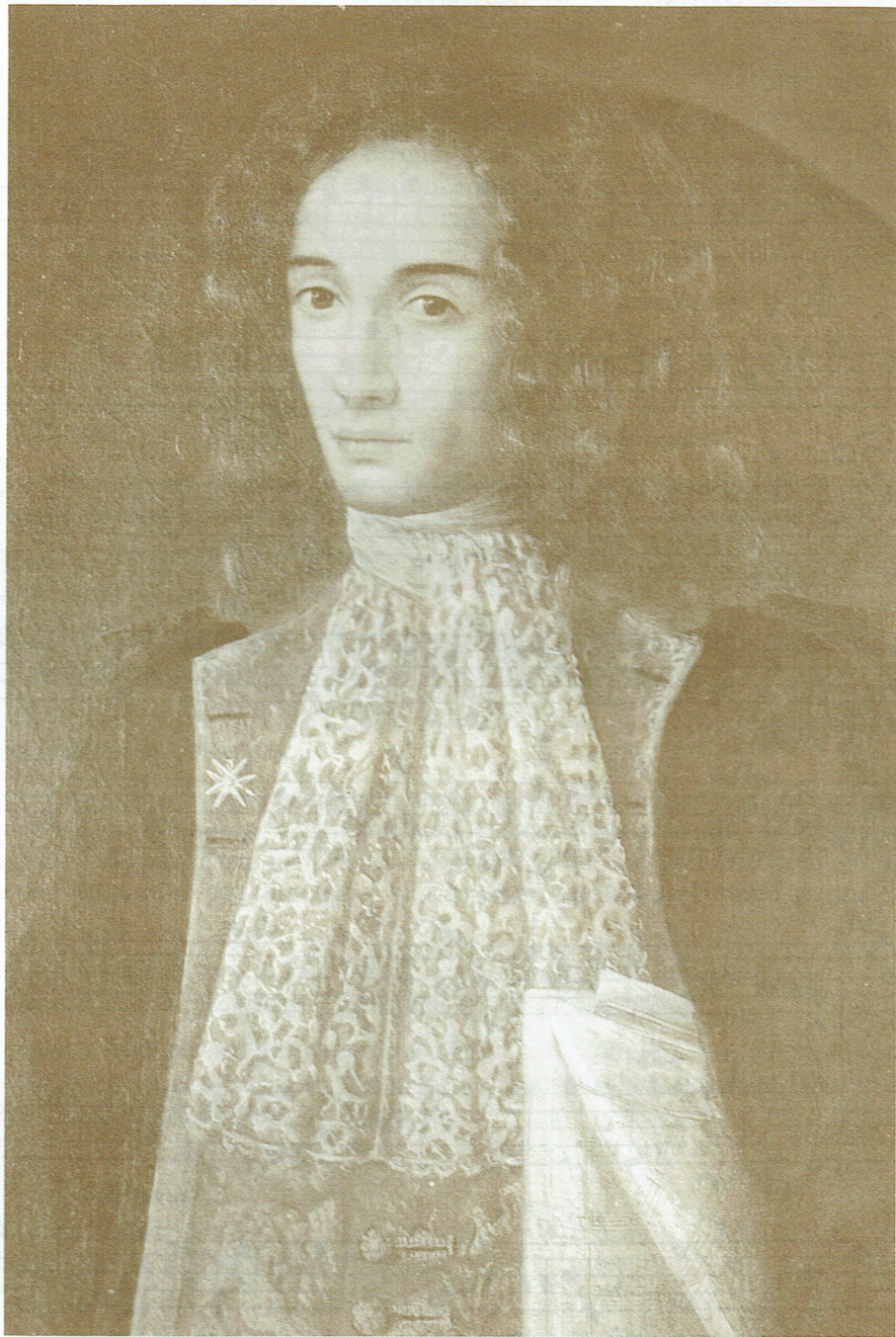
Portrait du jeune Alessandro Scarlatti, par Lorenzo Vaccaro?