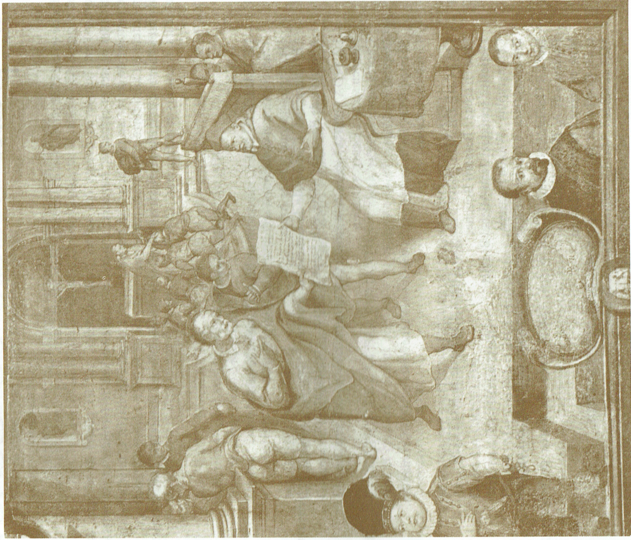
Approbation des statuts de la Confrérie, Fresque restaurée, Oratorio del Crocefisso, Roma